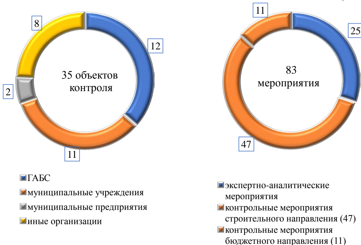
Диаграмма № 1