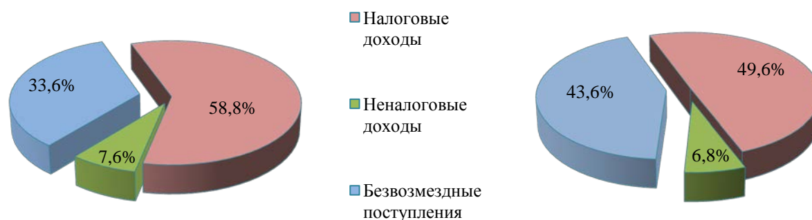
Диаграмма № 1

Доля неналоговых доходов также уменьшилась по сравнению с 2016 годом на 9,2 процентных пункта и составила 49,6% от общего объема доходов.