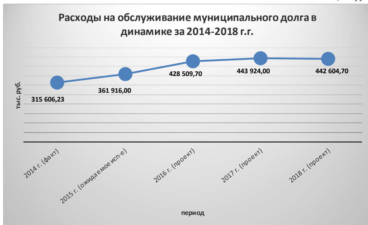
Диаграмма №3 (тыс.руб.)

Из представленной выше диаграммы видно, что расходы на обслуживание муниципального долга в Проекте бюджета на 2016 год и плановый период 2017-2018 годов планируются: